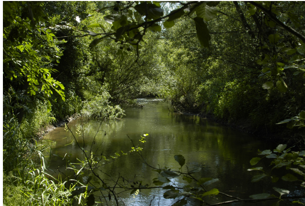
naturnaher Flussverlauf der Bega