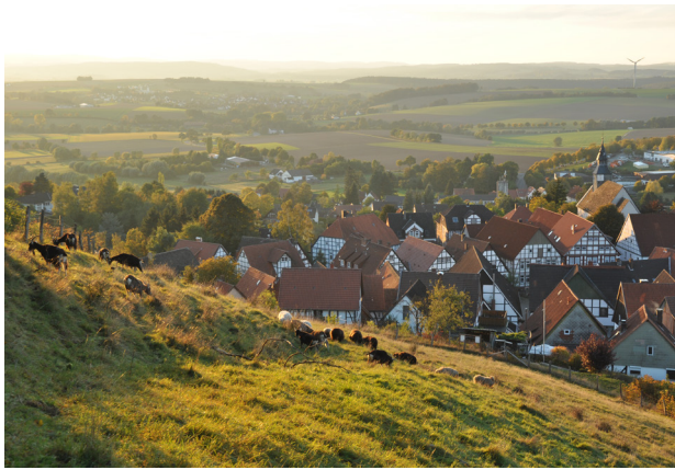
Beweidung Burgberg in Schwalenberg

Der Kreis Lippe ist Modellregion für die Umsetzung des „Bundeskonzepts Grüne Infrastruktur“ in ländlichen Regionen. Das Erprobungs- und Entwicklungsvorhaben wird vom Bundesamt für Naturschutz gefördert.