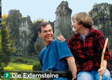
7 Die Externsteine