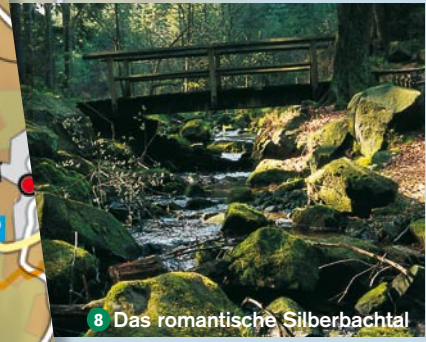
8 Das romantische Silberbachtal