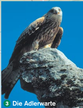
3 Die Adlerwarte