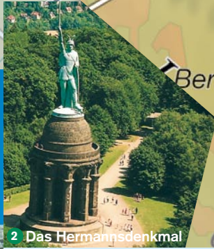
2 Das Hermannsdenkmal