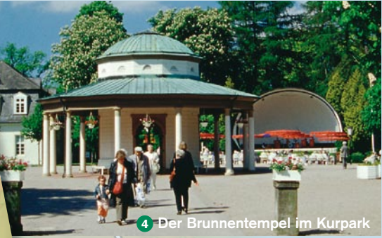
4 Der Brunnentempel im Kurpark