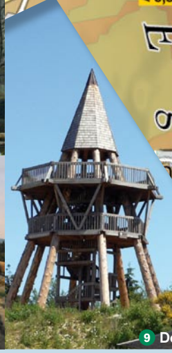
9 Der Eggeturm