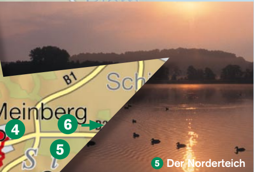
5 Der Norderteich