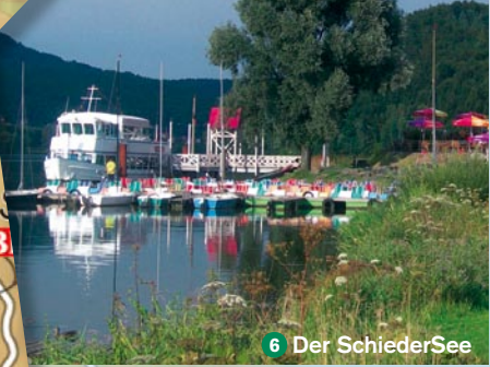
6 Der SchiederSee