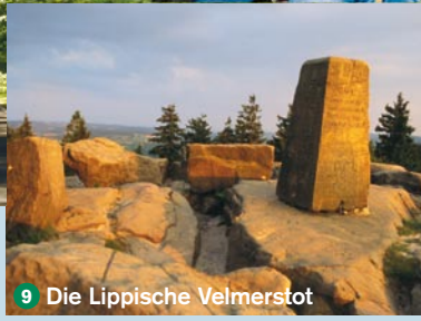
9 Die Lippische Velmerstot