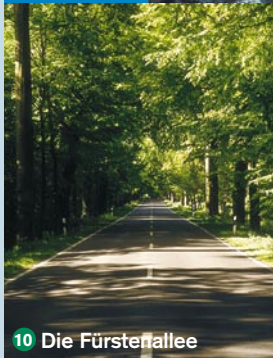
10 Die Fürstenallee